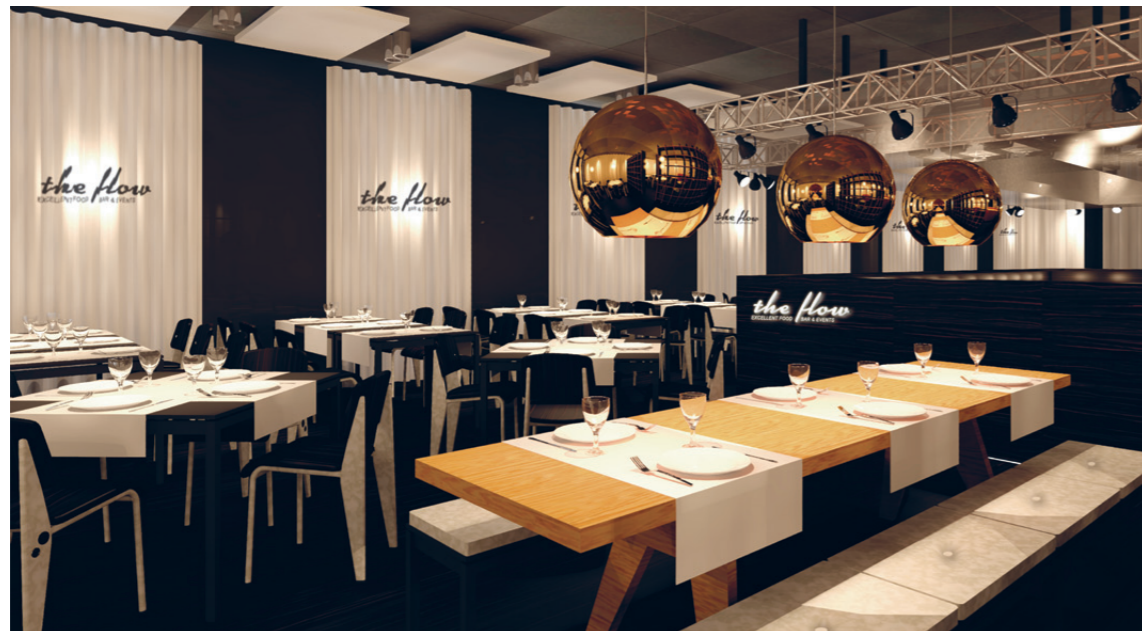
Znacht mit Live-Übertragung aus der Küche - das Restaurant The Flow.

gerecht werden. So ist ein Meeting-Raum nicht einfach nur Meetingraum, sondern kann auch am Abend für einen Computerkurs der Klubschule Migros genutzt werden. Die daskonzept ag entwickelte dazu verschiedene Konzept-Möbel. Nach dem Computer-Kurs verschwinden Computerbildschirm und Tastatur in der Tischplatte. In den Konferenzräumen können die stabilen Konferenztische (siehe S. 08) schnell und einfach zusammengeklappt und aufeinander gestapelt werden, um Platz für andere Veranstaltungen zu machen.