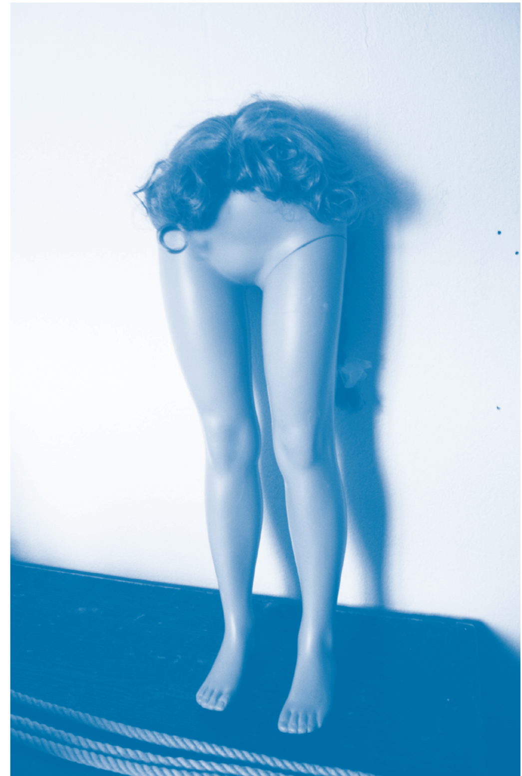
Die Coupe DADA 2016 der Künstlerin Fiorenza Bassetti – der Aufhänger der Ausstellung im August in der Konzeptionelle.