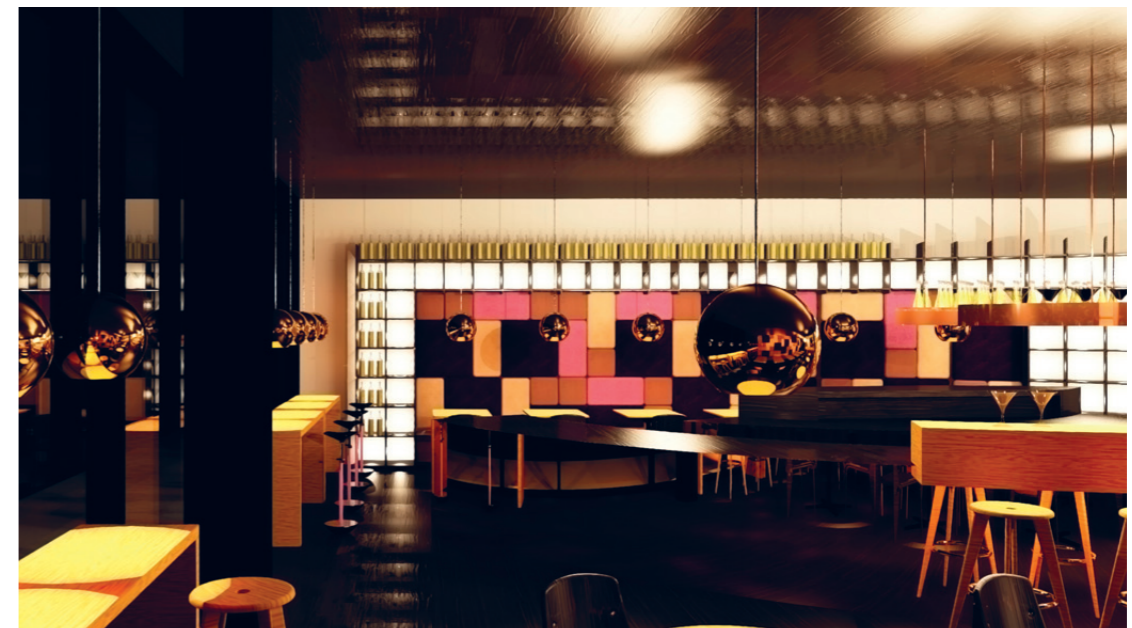
Waschen, trinken, plaudern - alles möglich in der Washbar.